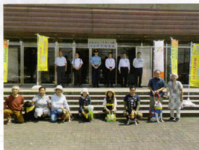
「熊取町わんだふるくらぶ」へのバンドナ贈呈式