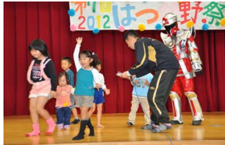
ケスンジャーのシール獲得