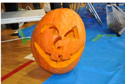
ハロウィンのかぼちゃ