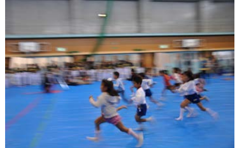
かけっこの子どもたち