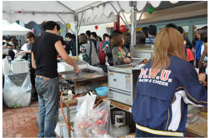
盛況な屋台のキッチン