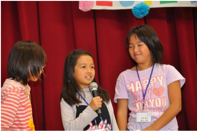
こども司会者のみなさん