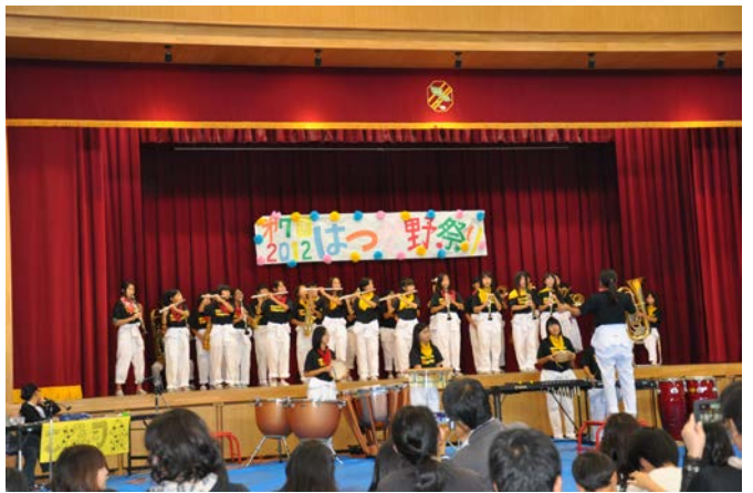
南池田中学校のブラスバンド演奏