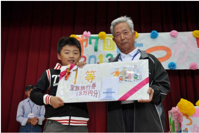
抽選会1等の賞品授与