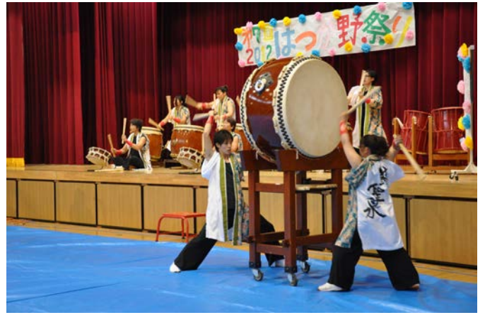
太鼓の勇壮な演奏